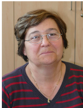
Frau Mies und Frau Sperling